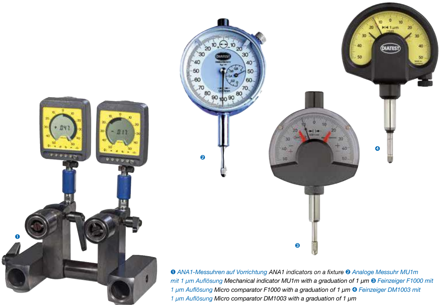
1 ANA1-Messuhren auf Vorrichtung ANA1 indicators on a fixture 2 Analoge Messuhr MU1m mit 1 µm Auflösung Mechanical indicator MU1m with a graduation of 1 µm 3 Feinzeiger F1000 mit 1 µm Auflösung Micro comparator F1000 with a graduation of 1 µm 4 Feinzeiger DM1003 mit 1 µm Auflösung Micro comparator DM1003 with a graduation of 1 µm